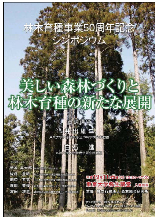
シンポジウム開催ポスター

詳しくは → http://ftbc.job.affrc.go.jp/ (独)森林総合研究所林木育種センターまで